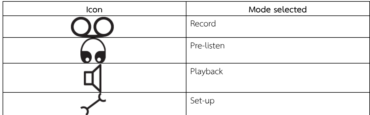
ตารางที่ ๗.๑ ไอคอนเลือกโหมด

หลังจากเปิดเครื่องขึ้นหน้าจอเริ่มต้นขึ้นจะแสดงชั่วโมงซึ่งจะแสดงชื่อของบันทึกเช่นเดียวกับจำนวนการแก้ไขของซอฟต์แวร์ ซอฟต์แวร์แล้วจะแสดงหน้าจอบันทึก (ดูรูปต่อไปนี้)