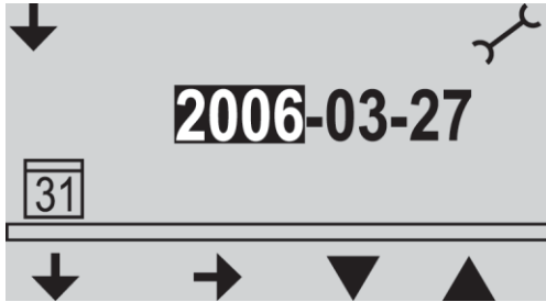
รูปที่ ๗.๔ หน้าจอการตั้งค่าสำหรับวันที่

ก่อนที่จะใช้บันทึก MP3 ที่คุณควรให้แน่ใจว่าวันที่และเวลาที่กำหนดอย่างถูกต้อง หากจำเป็นให้ปรับวันที่และเวลาดังต่อไปนี้ : ดูรูปที่ ๗.๑