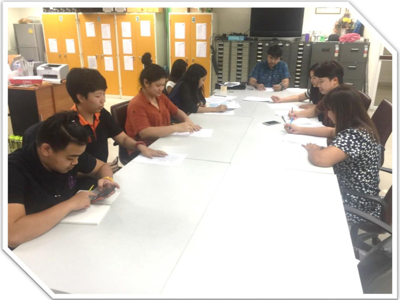
ภาพประกอบการแลกเปลี่ยนเรียนรู้ (KM) ของชุมชนสตูดิโอ (Studio Media)