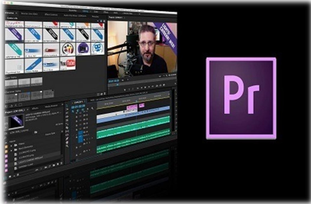
ภาพประกอบจากอินเทอร์เน็ต