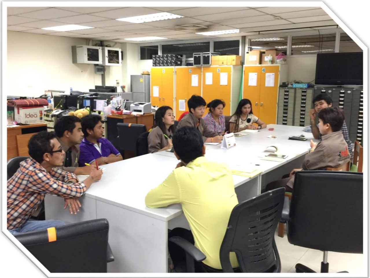
ภาพประกอบการแลกเปลี่ยนเรียนรู้ (KM) ของชุมชนสตูดิโอ (Studio Media)