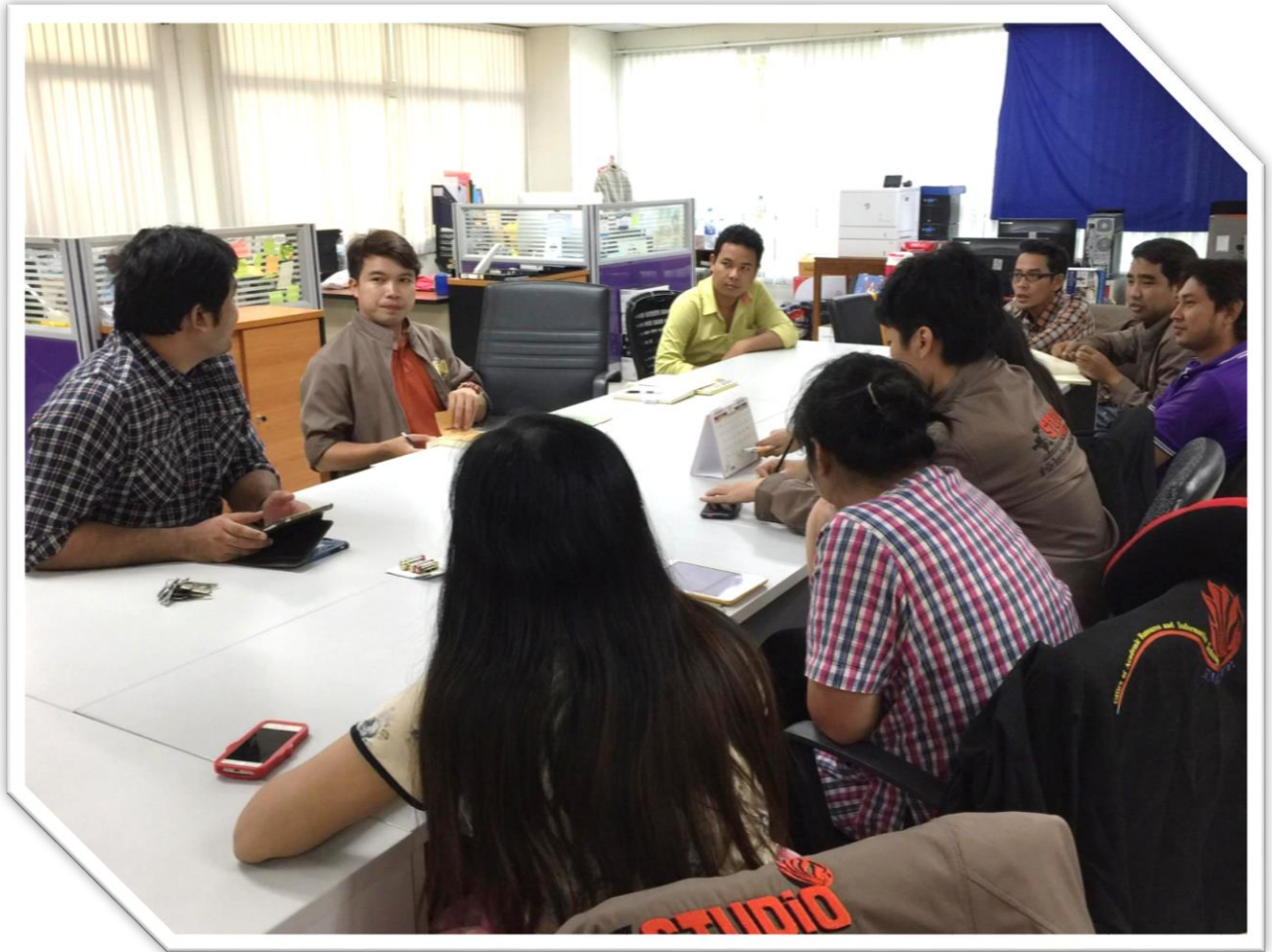
ภาพประกอบการแลกเปลี่ยนเรียนรู้ (KM) ของชุมชนสตูดิโอ (Studio Media)