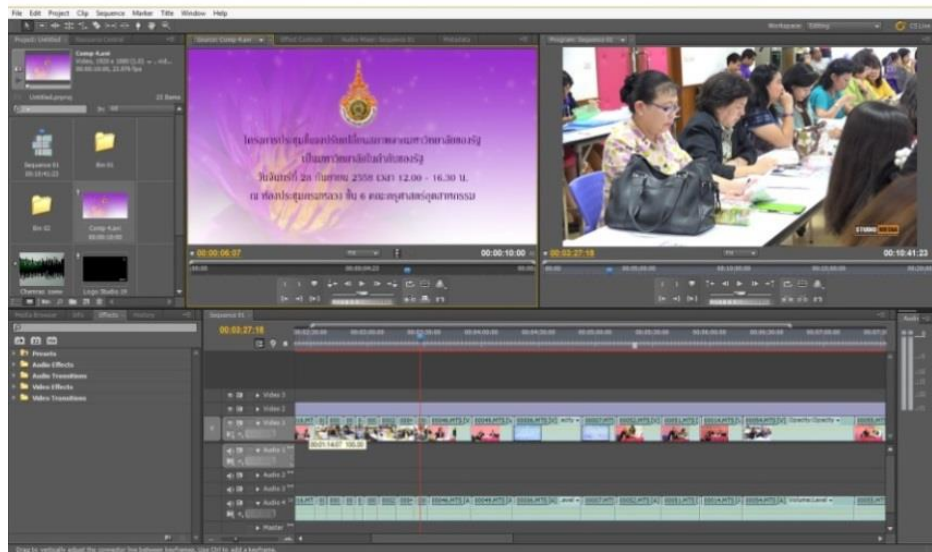
ขั้นตอนการสร้างภาพยนตร์การตัดต่อ (Editing)

ขั้นตอนที่ ๓ การตัดต่อ (Editing) หลังจากการถ่ายทำได้เสร็จเป็นที่เรียบร้อยแล้ว ต่อมาเราจะนำไฟล์วิดีโอที่ได้เข้ามาทำงานในโปรแกรมตัดต่อ เช่นโปรแกรม Premiere Pro เพื่อตัดต่อจัดเรียงและใส่เอฟเฟกต์ให้เป็นเรื่องราวอย่างที่เราวางไว้