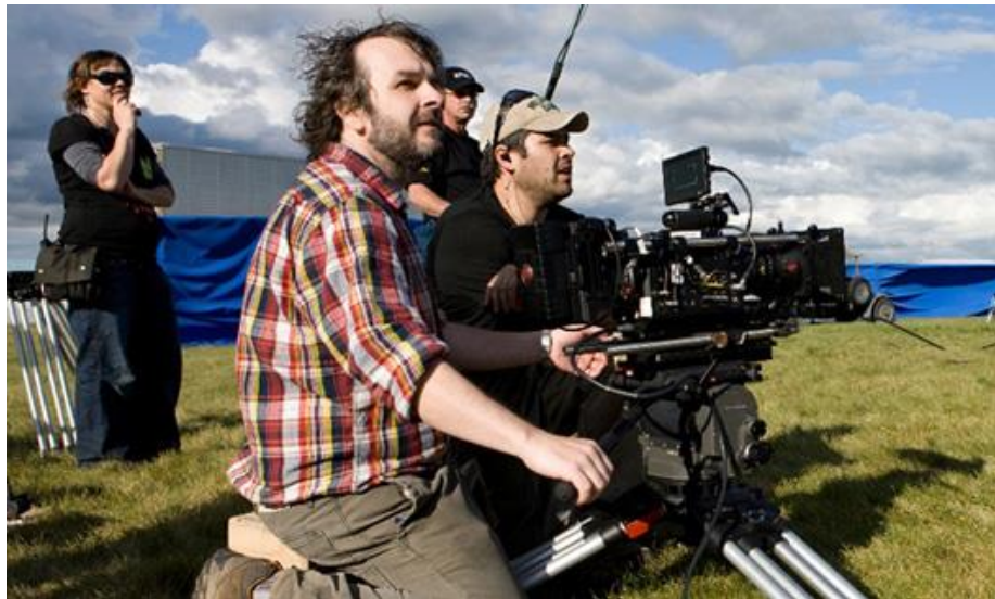
ขั้นตอนการสร้างภาพยนตร์การถ่ายทำ (Shooting)

ขั้นตอนที่ ๓ การตัดต่อ (Editing) หลังจากการถ่ายทำได้เสร็จเป็นที่เรียบร้อยแล้ว ต่อมาเราจะนำไฟล์วิดีโอที่ได้เข้ามาทำงานในโปรแกรมตัดต่อ เช่นโปรแกรม Premiere Pro เพื่อตัดต่อจัดเรียงและใส่เอฟเฟกต์ให้เป็นเรื่องราวอย่างที่เราวางไว้